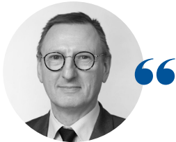
Christophe HERVOUET Président du tribunal administratif de Nantes

J ugeant les affaires provenant du territoire des Pays de la Loire, le tribunal administratif a aussi deux compétences nationales relatives aux refus de visa d'entrée sur le territoire français et aux refus de naturalisation. Il a enregistré un peu plus de 23 000 affaires en 2025 (13 % de plus qu'en 2024), dont plus de 12 000 consistaient en des recours contre des refus de visa d'entrée sur le territoire français ou des refus de naturalisation.